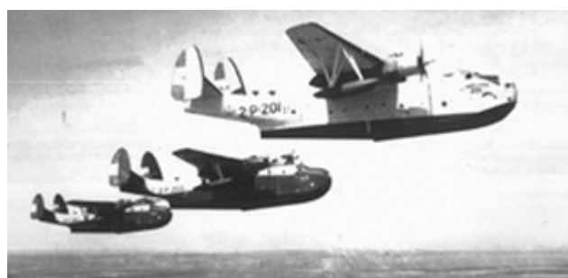
PBM-5S Mariner de la Armada Argentina